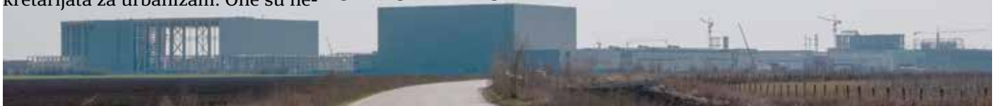
„Linglong“ tumači zakone kako mu je volja pa se za dozvole za gradnju svojih objekata obraćao nenadležnim organima

Ističu da u Zakonu o planiranju i izgradnji zaista postoji i odredba da se u okviru privredno-industrijsko kompleksa nadležnost za izdavanje dozvola utvrđuje pojedinačno za određene objekte, ali da se to odnosi na pojedinačne samostalne objekte u okviru istog kompleksa, a ne na pomoćne u funkciji glavnog.