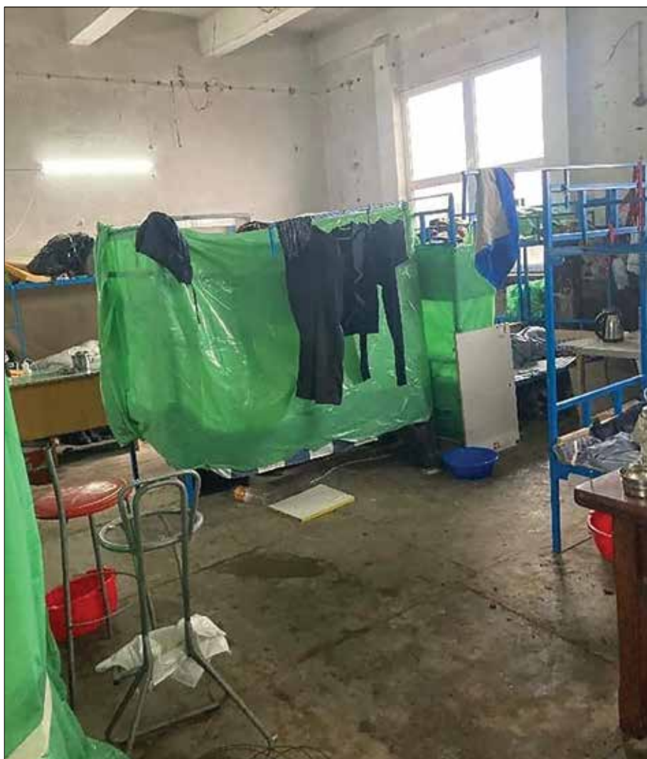
Smeštaj radnika u nelegalnim objektima je kao scena iz horor filmova

tome da li je investitor zaista postupio po naloženom, a sada je već izvesno da nije.