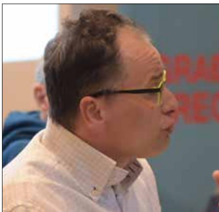
Dr Ognjen Radonjić

Radonjić je izneo podatke o trgovinskom odnosu između Srbije i Kine i konstatovao da se radi o klasičnom primeru odnosa siromašne i bogate države, odnosno o crpljenju naših resursa. Srbija u Kinu izvozi jeftine sirovine, a kupuje visokosofisticiranu opremu, pri čemu ostvaruje deficit. On je istakao da kineske investicije ne spadaju u one od