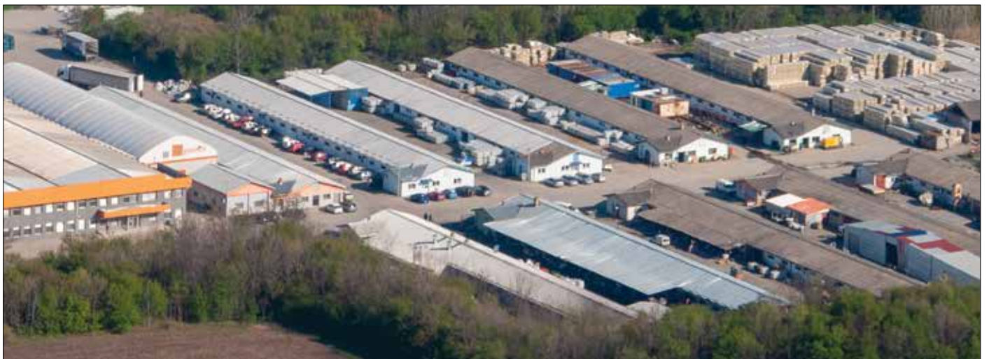
Barake, svojevremeno skladišta preduzeća iz sastava trgovinskog „Banat“, jesenas bile dom radnika iz Vijetnama

„Linglong“ nalazi i ne mali broj pripadnika bezbednosnih službi Kine, smatra politikolog Miroslav Samardžić, pozivajući se na iskustva iz drugih država.