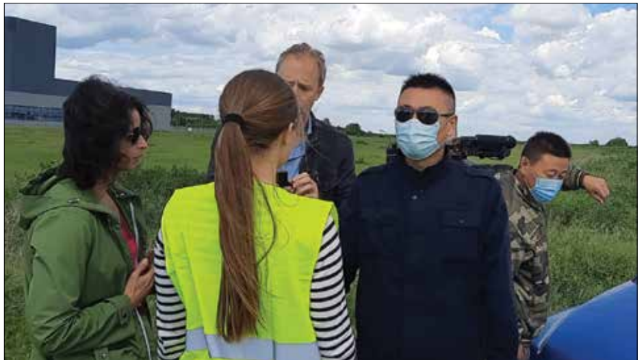
Tužilaštvo ne reaguje – novinari bez zaštite od kineskih bezbednjaka

– Aktivisti koji su bili u blizini su došli i praktično nas izbacili – seća se Iva-