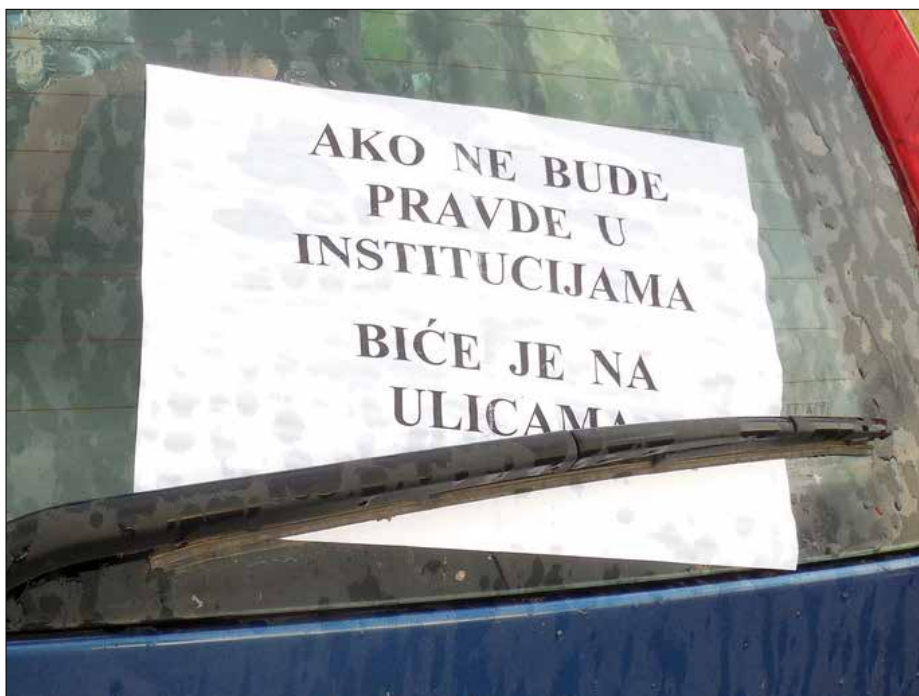
Poruka građana sa protesta kod gumare

Na placu „Linglonga“ se zidalo i bez građevinske dozvole, utvrdio je pokrajinski inspektor aprila prošle godine, naredivši zatvaranje dela gradilišta. Ni dva meseca posle toga nadležni organ – Pokrajinski sekretarijat za građevinarstvo – nije imao informacije o