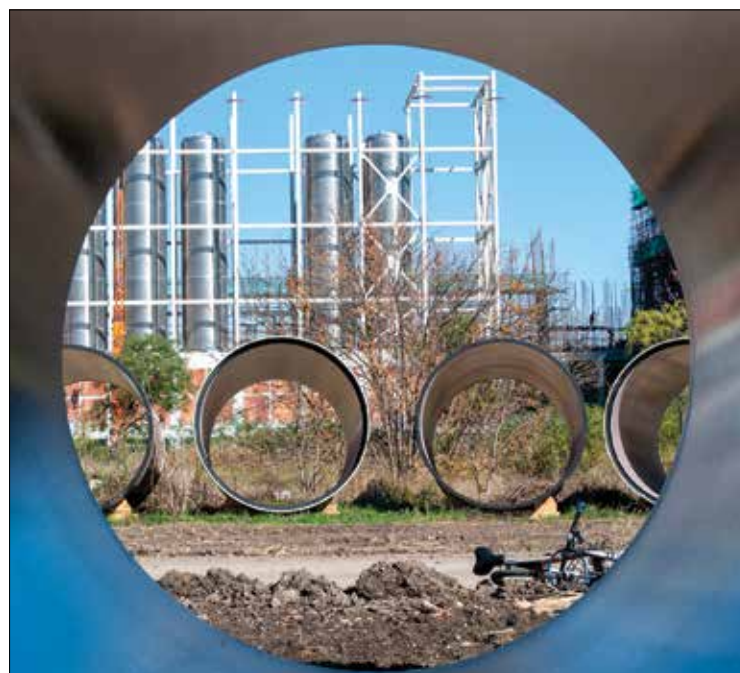
Prečnik dva metra – cevi za „izlučivanje“ kišnice sa sto hektara u vlasništvu „Linglonga“ na ulazu u Zrenjanin iz pravca Beograda. Šta će kroz njih zaista oticati u Begej?!

Postavlja se pitanje zašto država Srbija, ako već tolikim procentom učestvuje u ovoj kineskoj investiciji, nije ugovorila i srazmerni vlasnički udeo u budućoj fabrici?