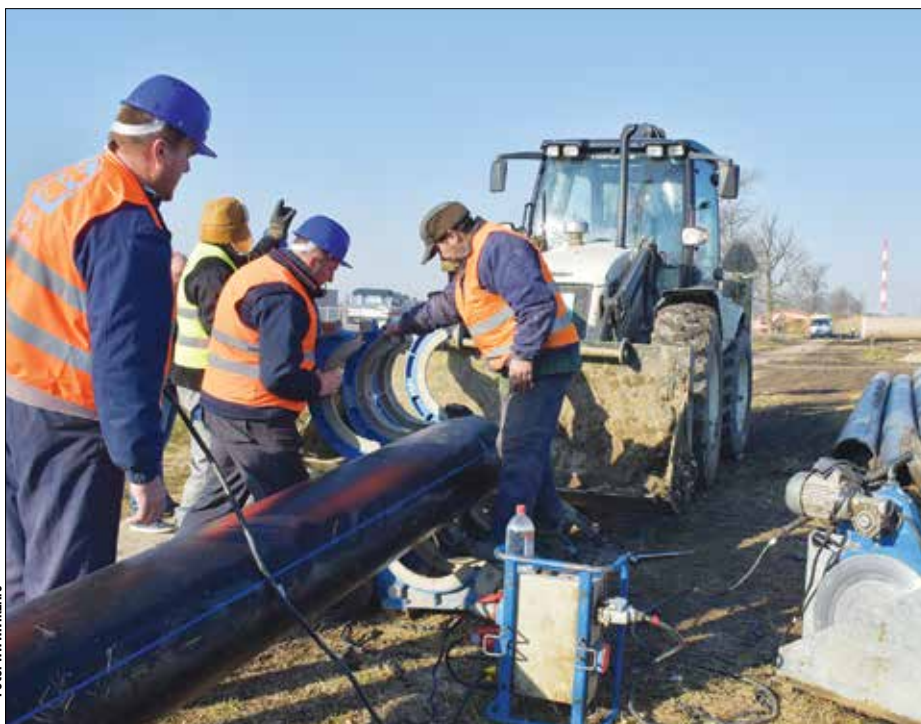
Polaganje vodovodnih cevi za „Linglong“ krajem 2021.

Isto je u svojoj analizi zaključio i zrenjaninski advokat Dušan Prijić. On podseća da je zrenjaninsko javno