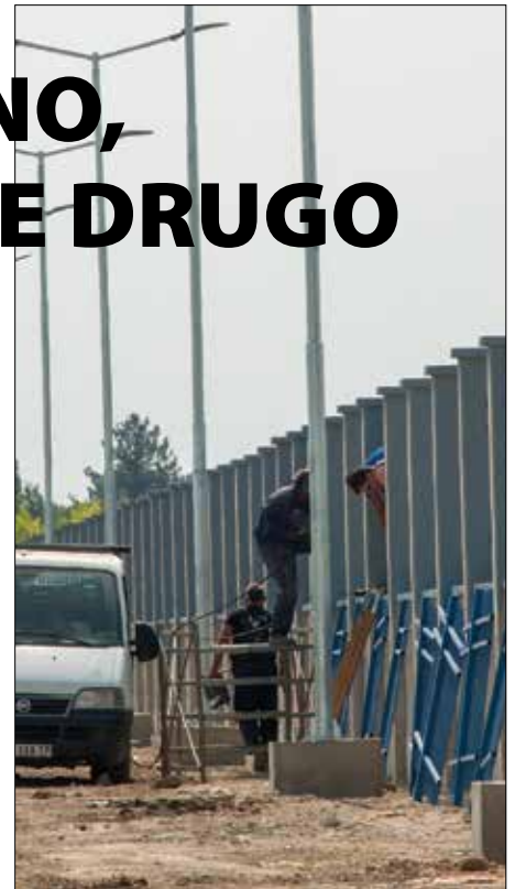
Dokumentaciju za podizanje ograde oko „Linglonga“ odobrila je Pokrajina

– Pomoćni objekti jesu u funkciji glavnog – fabrike guma. Sami, oni ne