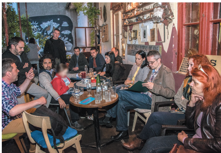
Jedan od sastanaka u Građanskom preokretu