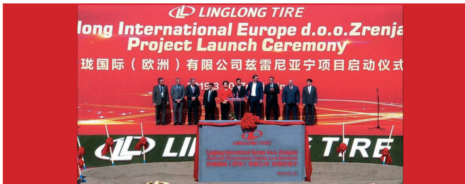
Snimak sa svečanosti postavljanja kamena temeljca fabrike Ling Long