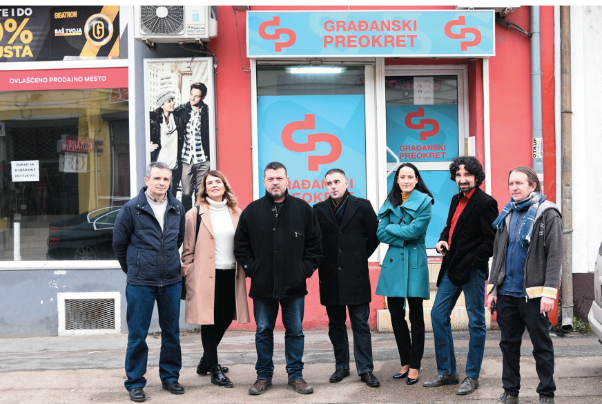
Sedište Gradanskog preokreta je u Pupinovoj ulici

Kada ćete se posvetiti ovom slučaju i podići optužnice? Na leto, kada nam opet potpuno presuše slavine? Ili na kukovo leto?